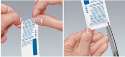
الرسم التوضيحي 2