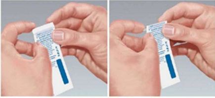
الرسم التوضيحي 1