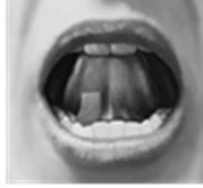
الرسم التوضيحي 3