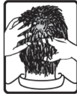
עסה את הקרקפת