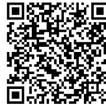
ليناليدوميدي تارو 2.5 ملغ