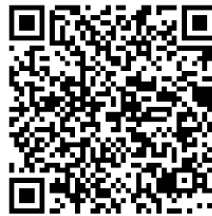
ليناليدوميدي تارو 5 ملغ