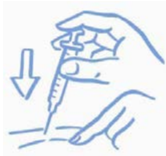
الرسم التوضيحي "أ": اقرص الجلد قليلاً واحقن حسب التعليمات

3. اقرص الجلد قليلاً. أدخل الإبرة حسب تعليمات الطبيب. حرر الجلد (انظر الرسم التوضيحي "أ").