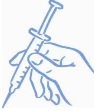
الرسم التوضيحي 7: المحقنة جاهزة للحقن