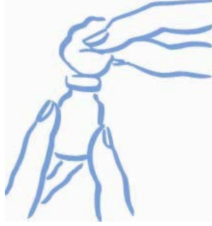
الرسم التوضيحي 1: تنظيف السدادة المطاطية بالكحول