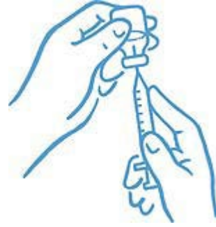
الرسم التوضيحي 4: طرف الإبرة في السائل

9. قبل إخراج الإبرة من القارورة، افحص إذا كانت هناك فقاعات هواء في المحقنة. في حال كانت فيها فقاعات، أمسك القارورة، المحقنة والإبرة بشكل عامودي، ثم انقر على طرف المحقنة حتى تظهر الفقاعات في الأعلى. أخرج الفقاعات مستخدماً المكبس واسحب السائل ثانية حتى تحصل على الجرعة الصحيحة (انظر الرسم التوضيحي 6).