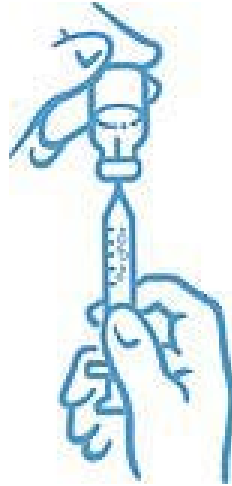
الرسم التوضيحي 6: إخراج الفقاعات وملء المحقنة بالسائل للحصول على الجرعة الصحيحة

9. قبل إخراج الإبرة من القارورة، افحص إذا كانت هناك فقاعات هواء في المحقنة. في حال كانت فيها فقاعات، أمسك القارورة، المحقنة والإبرة بشكل عامودي، ثم انقر على طرف المحقنة حتى تظهر الفقاعات في الأعلى. أخرج الفقاعات مستخدماً المكبس واسحب السائل ثانية حتى تحصل على الجرعة الصحيحة (انظر الرسم التوضيحي 6).