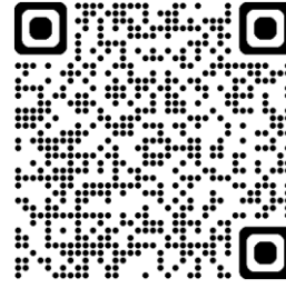
زيبركسا 7.5 ملغ