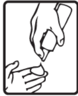
اقلب الحاوية واضغط على المرش