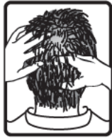
دلك فروة الرأس