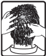
עסה את הקרקפת