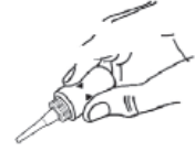
איור 8 – לאחר הלחיצה אוריזון ישתחרר לתוך תעלת האוזן החיצונית