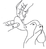
איור 7 – לחץ בעדינות על המכל