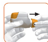
לחץ כאן ומשך