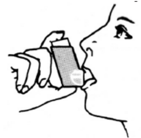
(الرسم التوضيحي 2)

3. أمسك المنشقة بيدك وشد شفطيك بقوة حول الفوهة. (الرسم التوضيحي 2).